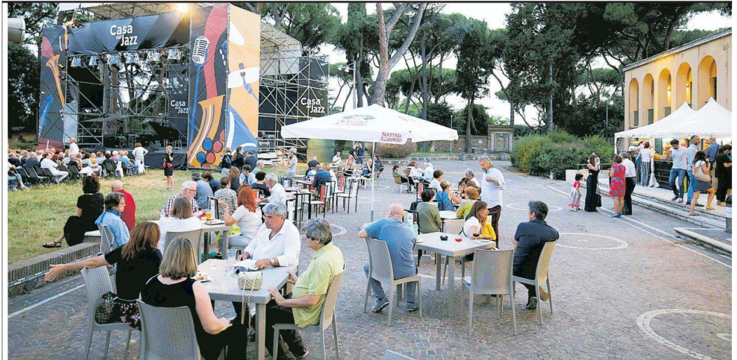
IL BILANCIO: DATI RECORD

È stata una stagione d'oro per la Casa del Jazz (foto accanto)