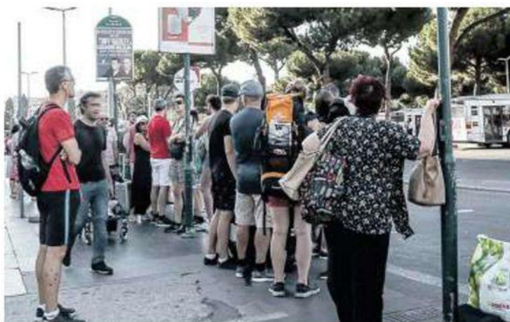
L'attesa dei bus in piazza dei Cinquecento