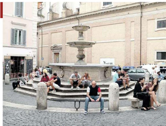
Piazza Madonna dei Monti di giorno, la sera diventa terra di nessuno